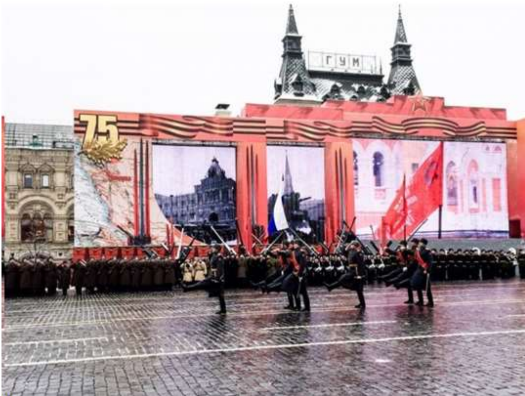
2017 – Отмечался столетний юбилей Октябрьской революции.